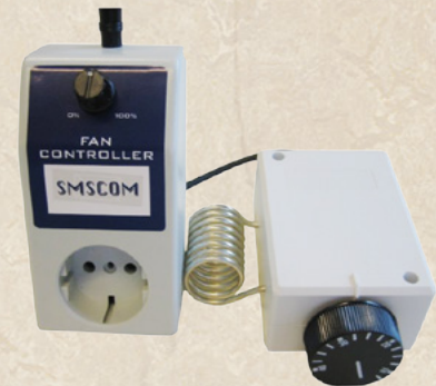
SMSCOM Fancontroller + Thermostat

Am besten kann das Raumklima durch Steuergeräte (Fancontrol) geregelt werden.